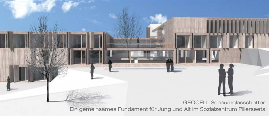
GEOCELL Schaumglasschotter: Ein gemeinsames Fundament für Jung und Alt im Sozialzentrum Pillerseetal

GEOCELL Schaumglasschotter bildet das optimale Fundament eines Seniorenwohn- und Pflegeheimes mit integriertem Gemeinde-Kindergarten. Ausschlaggebend bei der Wahl von GEOCELL waren für das Planungsteam die technischen und wirtschaftlichen Vorteile des Bodenaufbaus mit Schaumglasschotter.