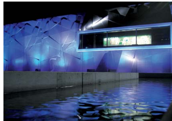
Ausgezeichnet mit dem Prix Evenir 2007 sowie dem Idee-Suisse-Innovationspreis 2009.