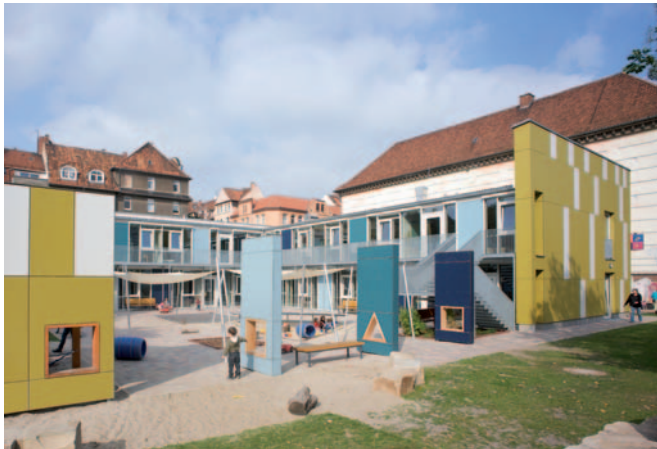
Kindertagesstätte Siloah: lastabtragende Wärmedämmung für jedes Fundament

Mehr Grund zum Wohlfühlen haben Bauherren, die bei Bodenaufbauten auf GEOCELL Schaumglasschotter setzen. Denn das hochwertige Recycling-Produkt aus Altglas verbindet alle Materialeigenschaften, die im Hochbau gefordert sind. Schaumglas ist lastabtragend, ersetzt die Rollierung und sorgt für einen wärmebrückenfreien Aufbau unter der Keller- oder Bodenplatte – die ökologische und kostensparende Alternative für Bodenaufbauten.